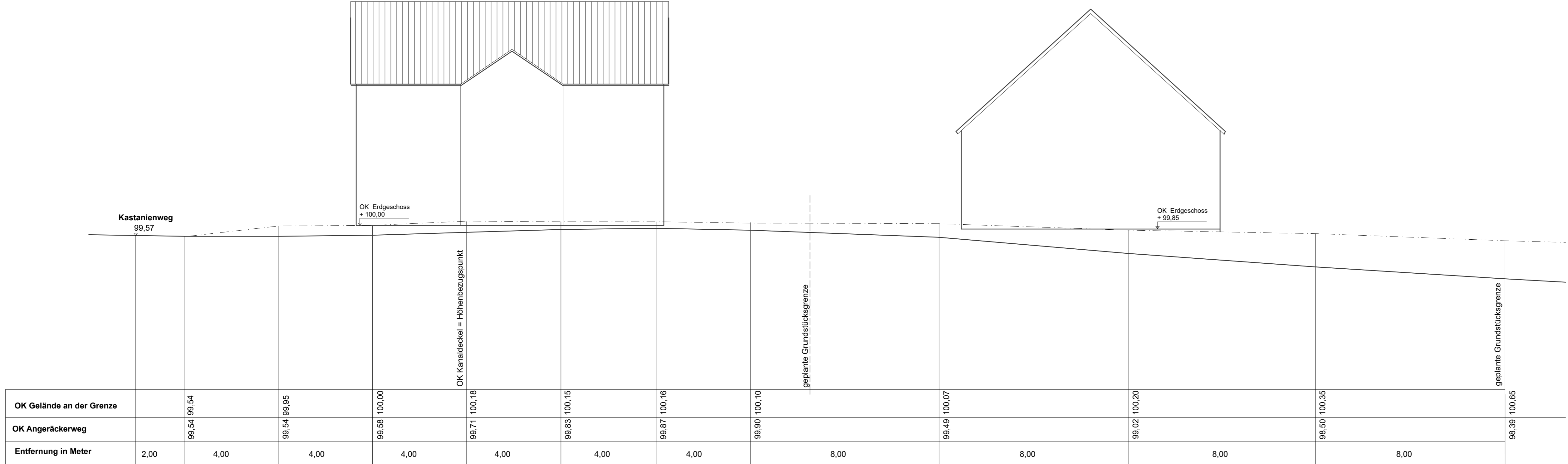
Geländeschnitt A - A M 1:100

Rechtskräftige Planfassung geänderter Entwurf vom 08.10.2019 redaktionell geändert am 18.02.2020